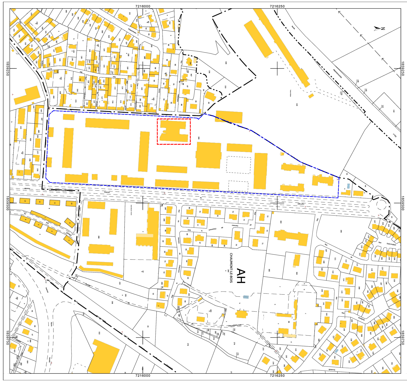
PLAN DE SITUATION au 1/1000°